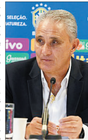
Titi convoca dia 7

O lateral direito Daniel Alves será convocado? Alguma surpresa entre os zagueiros? Éverton Ribeiro ou Philippe Coutinho no meio-campo? Ou os dois? Com a confirmação de Pedro (Tite foi muito claro em suas últimas entrevistas ao elogiar o atacante do Flamengo), uma das dúvidas no ataque será pela presença de Matheus Cunha ou Roberto Firmino. Um deles deve sobrar!