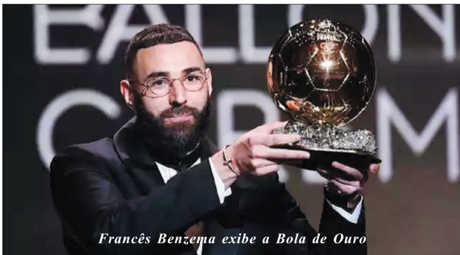
Francês Benzema exibe a Bola de Ouro

O reinado de Messi (sete bolas) e Cristiano Ronaldo (cinco bolas) pelo menos na escolha de melhor jogador do mundo parece que está chegando ao fim. O atacante francês Karim Benzema (Real Madri) foi o escolhido em premiação da 66ª Bola de Ouro, realização da revista France Football.