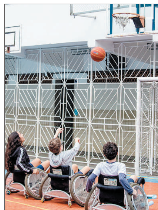
Alunos participaram do jogo de basquete em cadeira de rodas