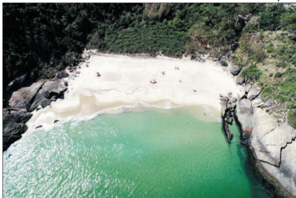
Praia do Sossego aprovada pelos júris nacional e internacional