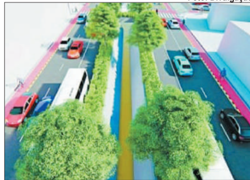
Maquete da Alameda